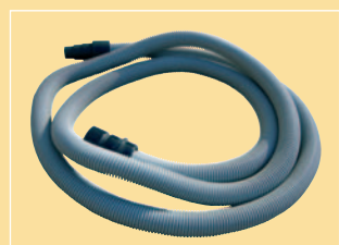
2,7 MT. FLEXIBLE HOSE Ø 28 MM