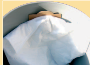
DISPOSAL BAG FOR CARTRIDGE PROTECTION