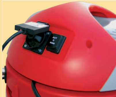
ELECTRICAL TOOL PLUG CONNECTION