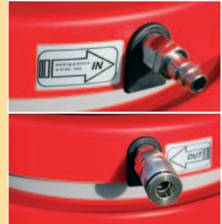
IN/OUT PNEUMATIC TOOL AIR CONNECTION