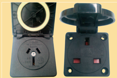
US OR UK PLUG VERSION ON DEMAND