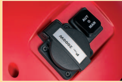
ON/OFF SWITCH FOR AUTOMATIC/MANUAL MODE